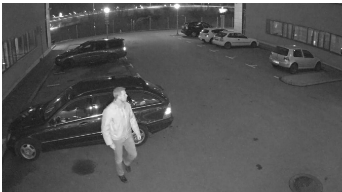
빛이 특정 수준 아래로 감소하면 카메라가 자동으로 야간 모드로 전환되어 어두운 환경에서도 우수한 품질의 이미지를 제공합니다.

원격 줌 및 OptimizedIR을 포함하는 AXIS P14 카메라 설치에서 화각이 조절되면 조명 각도는 자동으로 줌 레벨에 맞춰 조정됩니다. 이 이미지에 항상 빛을 최대한 제공하기 위해 조명 각도는 카메라의 움직임에 따릅니다.